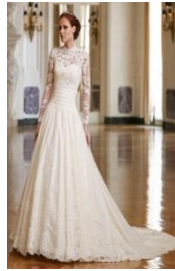
Sin necesidad de chal