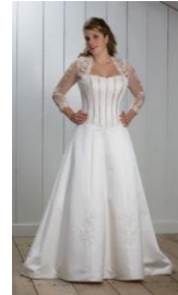
Sin necesidad de chal